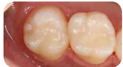
Vue post-opératoire montrant une adaptation parfaite à la dent naturelle