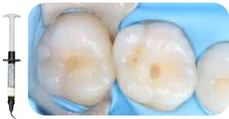
Préparation d'une petite cavité de classe I