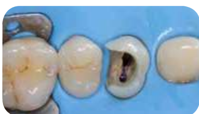
Une approche directe a été choisie dans ce défi post-endodontique