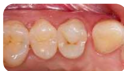
Le rappel à six mois montre une bonne intégration avec les tissus dentaires environnant.