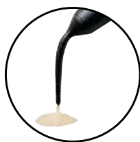
Essentia HiFlo Composite universel photopolymérisable fluide

Une teinte unique pour toutes vos restaurations