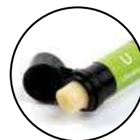
Essentia Composite universel photopolymérisable condensable

900739 Essentia HiFlo Seringue, U (1 x 2mL) 900741 Essentia LoFlo Seringue, U (1 x 2mL) 900970 Essentia Seringue, U (1 x 2mL) 900998 Essentia Unitips, U (15 x 0.16mL)