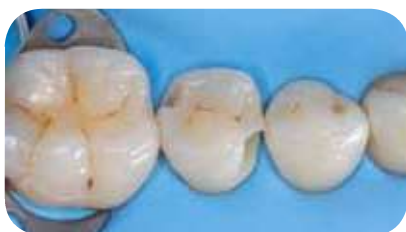
Air abrasion d'une lésion non carieuse