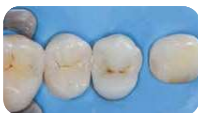
Stratification avec everX Posterior comme substitut dentinaire, recouvert d'Essentia Universal