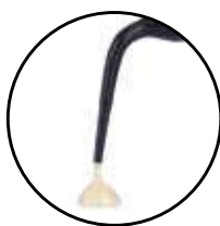
Essentia LoFlo Composite universel photopolymérisable injectable