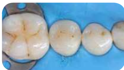
Restauration avec Essentia LoFlo Universal