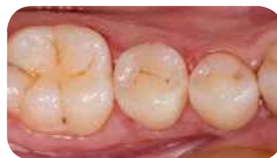
Vue post-opératoire après polissage