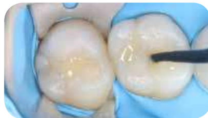
Restauration avec Essentia HiFlo Universal