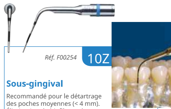
Réf. F00254 10Z

Instrument fin et rond adapté au détartrage des poches de profondeur inférieure à 2-3 mm.