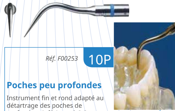
Réf. F00253 10P