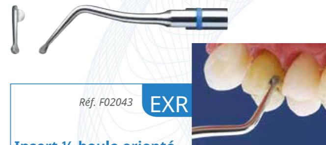
Réf. F02043 EXR

Les inserts Excavus procurent une qualité d'usinage excellente due à la régularité de leur revêtement de diamant*.