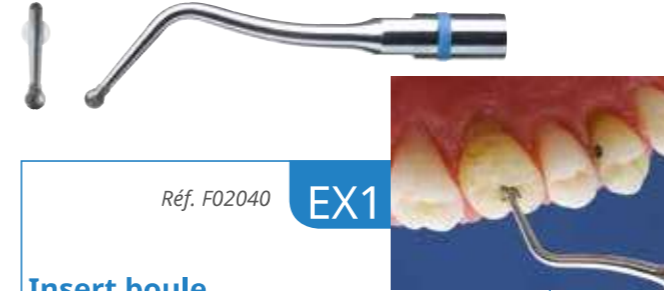
Réf. F02040 EX1