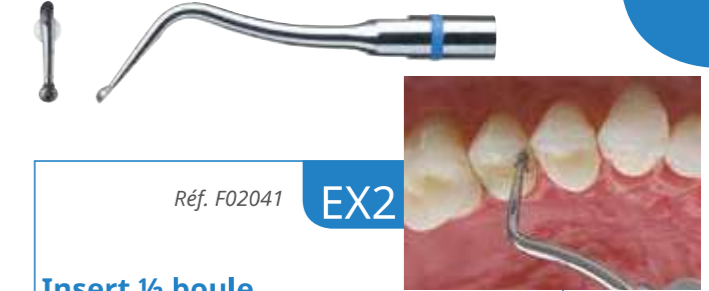
Réf. F02041 EX2

• Préparation de la face occlusale et des bords cervicaux. • Élimination de la structure dentaire hypominéralisée.