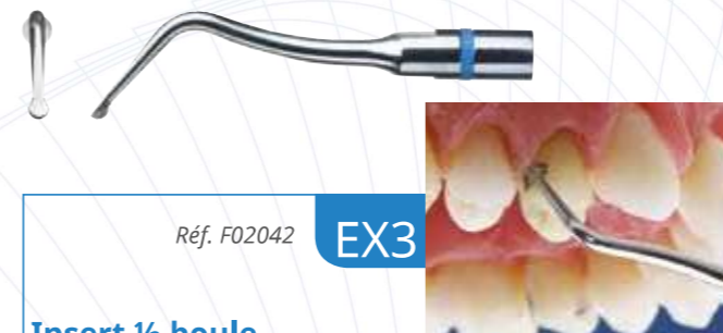
Réf. F02042 EX3

Préparation de la face mésiale sans endommager la dent adjacente.