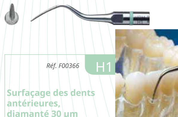
Réf. F00366 H1