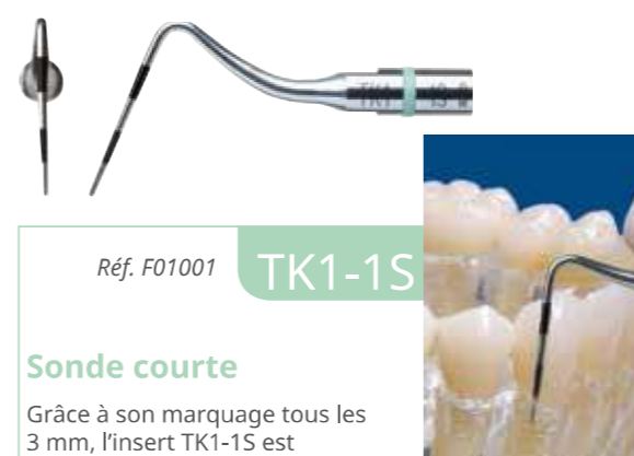
Réf. F01001 TK1-1S