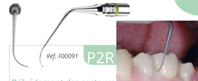
Réf. F00091 P2R