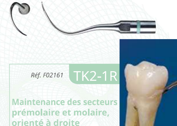
Réf. F02161 TK2-1R

Recommandé pour la maintenance des poches modérées à profondes et les furcations. Equivalent de la sonde de Nabers.