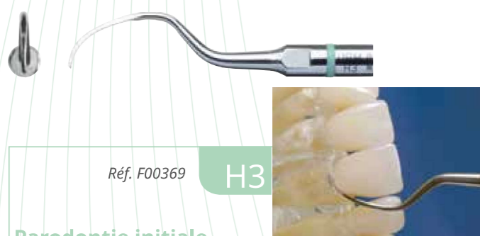
Réf. F00369 H3