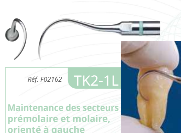
Réf. F02162 TK2-1L

Les inserts sonde TK1 s'utilisent sans pression en suivant le contour des poches et en effleurant la surface radulaire.