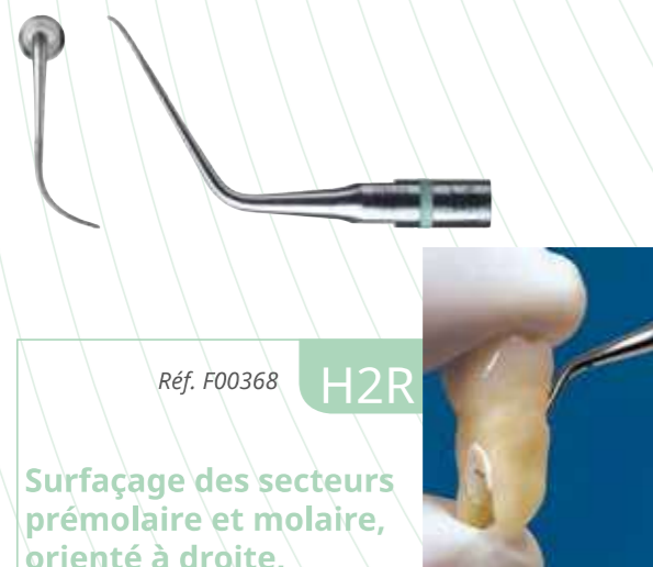
Réf. F00368 H2R

L'insert H1 doit être utilisé sans pression et au-dessus de l'attache épithéliale puisqu'il est abrasif.