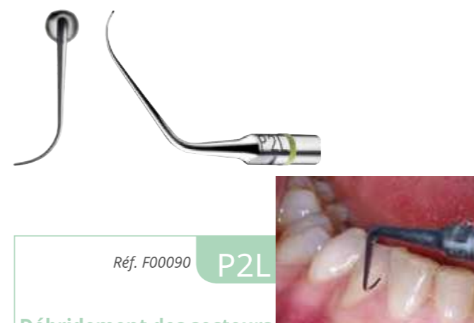
Réf. F00090 P2L