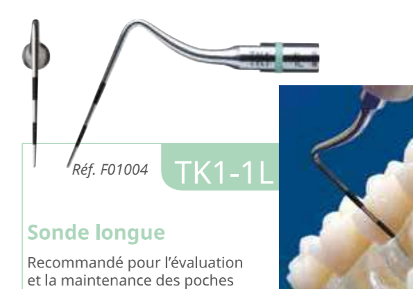
Réf. F01004 TK1-1L

Grâce à son marquage tous les 3 mm, l'insert TK1-1S est recommandé pour évaluer la profondeur des poches de faible et moyenne profondeur (< 4 mm), et pour la maintenance des cas simples.