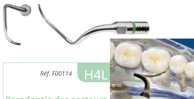
Réf. F00114 H4L

L'insert H3 est descendu dans la poche parodontale sans risque de blesser le ligament. La cavitation va faire remonter les débris.