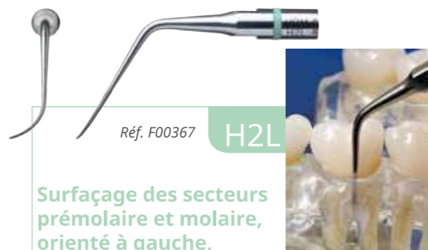
Réf. F00367 H2L

Les inserts H2 sont également efficaces pour le traitement des abcès.