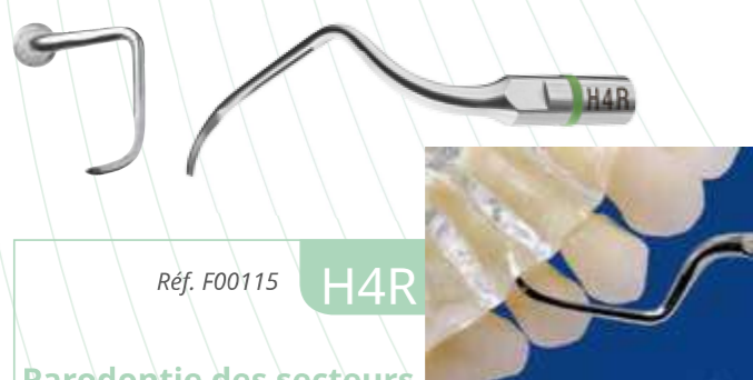
Réf. F00115 H4R