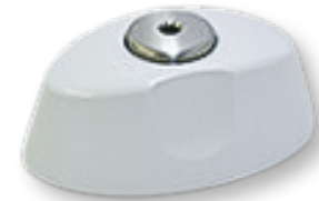
Calibreur de couple Réf : Z1056

Fonctionne avec 2 piles rechargeables Ni-MH