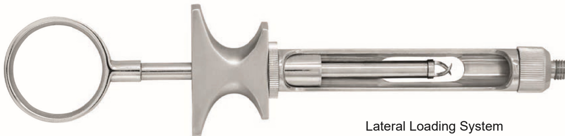
Lateral Loading System