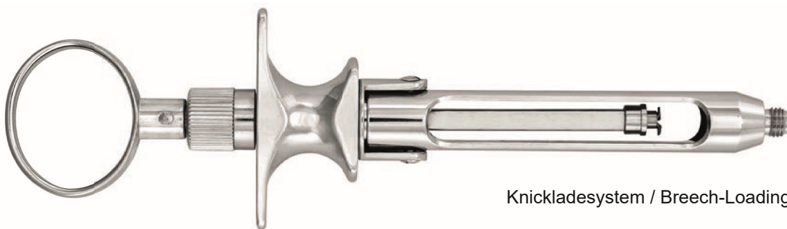
Knickladesystem / Breech-Loading-System