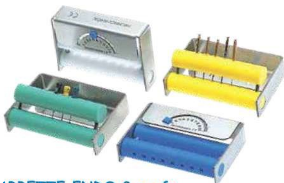
BARRETTE ENDO 8 perfo. • Réf. 182210 - Format 6,8 x 4,6 x 1,7 cm

Un Grand Classique ! Acier inoxydable et téflon. Multi orientable. Coloris 2 4 5 8. Curseur silicone intégré pour compter le nombre d'utilisations.