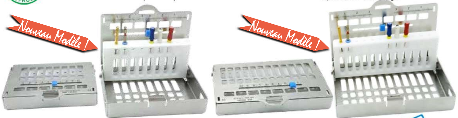
ENDO PRO - 8 perfo. • Réf. 182350 - Format 7,7 x 5,8 x 2 cm

1 endomètre + 1 stérimètre pour compter le nombre d'utilisations. Couvercle avec système de verrouillage.