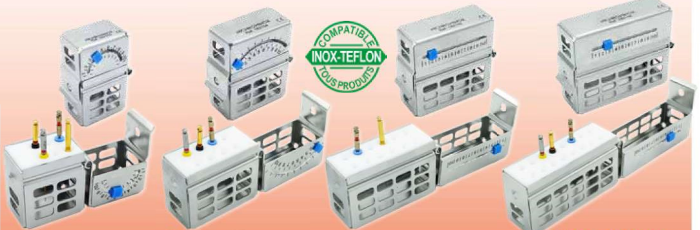
ENDO ZIPPO 6 Réf. 182153 Format 2,3 x 3,5 x 5 cm

Une collection complète de coffrets dédiés aux séquences endodontiques ! Formats compacts, adaptés pour stockage en cassettes. Acier inoxydable et téflon, compatibles thermolaveurs. Traitement de surface anti-tâches.