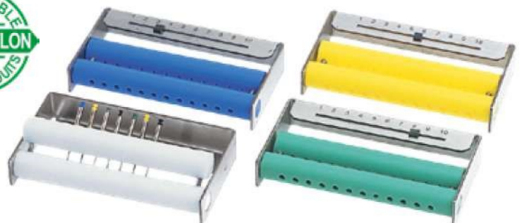
BARRETTE ENDO 12 perfo. • Réf. 182260 - Format 9 x 5 x 1,7 cm